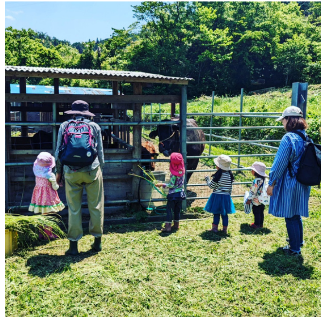
▲5/11 森のようちえん@どんぐり王国

過去に体験したことでも、久しぶりにやってみると、また違った感覚を受けることがあります。みなさんも小さい頃にやったことをお子さんと一緒にやってみてはいかがでしょうか。（ゆ）