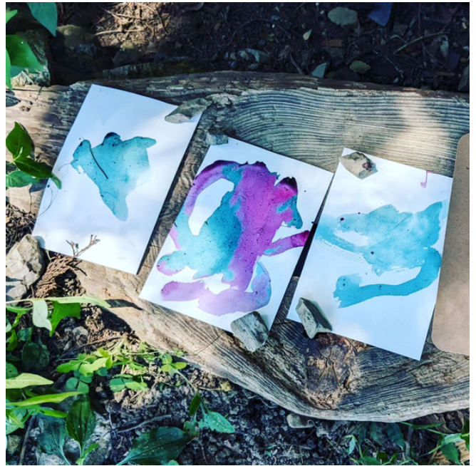
▲9/4 森のようちえん@山の基地（ブドウの色水あそび）

当時、森のようちえんを始めるにあたって、人数が集まるか不安だった私は、「はじめは集団の中で育てられない可能性が高くて、そのことにもやもやしています。」と話してみました。すると先生は、あー！それめっちゃ分かるよー。と共感してくださった上で「大丈夫、2人いれば、たった2人でも、十分コミュニケーション能力は身に付くから。たくさんの子が幼稚園や保育園に行ってるでしょ？じゃあ、みんなにコミュニケーションの能力って身に付いてるのかな？」と問いかけてくれて、自分のもやもやは一気に晴れました。一番大切なのは、集団の人数ではなくて、目の前の相手に自分の気持ちを伝えながら、いい関係を築いていく練習を積み重ねていくことで、そしてそのやりとりを見守ってくれる環境だなと。今でも折に触れて思い出しながら、1つの1つのコミュニケーションを大切に積み重ねていきたいなあと心がけています。（ち）