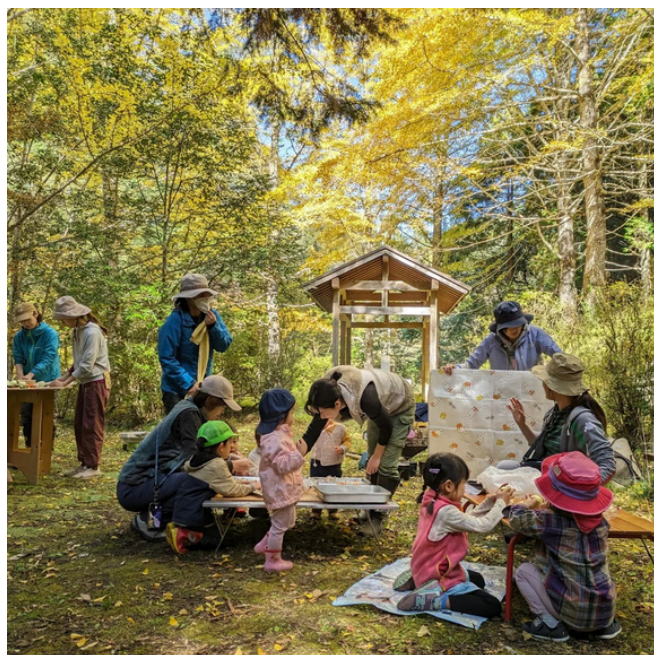
▲11/2 森のようちえん@桂川溪谷（野村町野村）

映えないシーンの意味を伝えるには、現場でじっくり観察したり、そこに至るまでにどんな出来事があったのかを把握したりすることが必要です。そんなふうに丁寧な関わりやそれをふまえた発信ができていだろうか？と、自分たちのあり方を見つめながら活動していけたらと考えています。（ゆ）