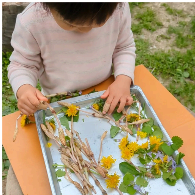
▲4/15 森のようちえん@山の基地（野草の天ぷらづくり）