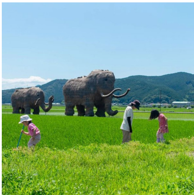
▲7/4森のようちえん@わらマンモス